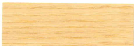
Incoloro / Brillante