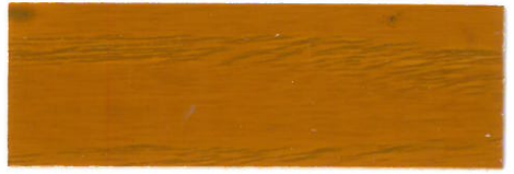
Castaño / Brillante