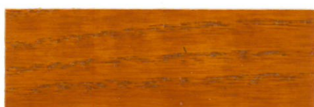
Pino Miel / Satinado