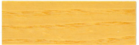
Incoloro / Brillante