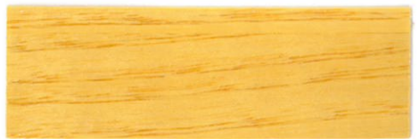
Incoloro / Brillante