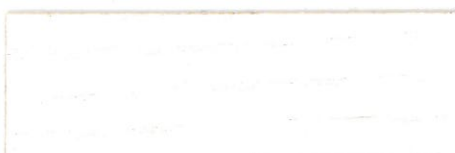
Blanco / Satinado