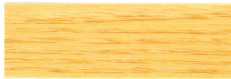
Incoloro / Satinado