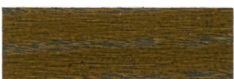
Nogal / Satinado