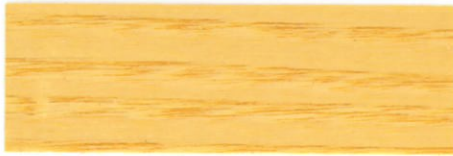
Incoloro / Satinado