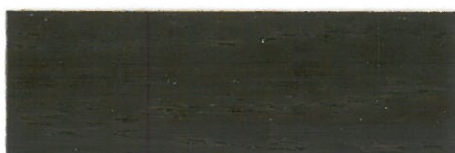
Nogal oscuro / Satinado