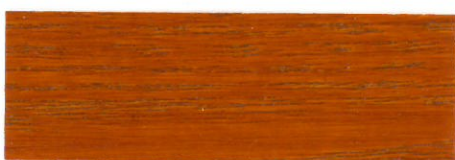
Teca / Brillante