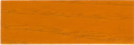
Cerezo / Brillante