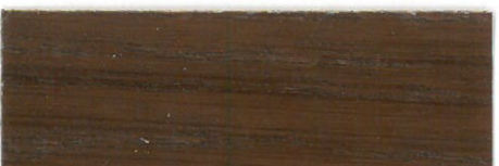
Palisandro / Satinado