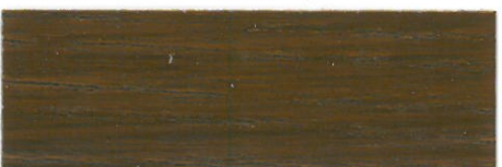
Nogal / Satinado