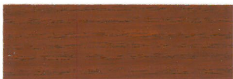
Caoba / Satinado