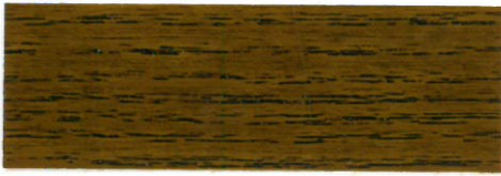
Nogal / Brillante