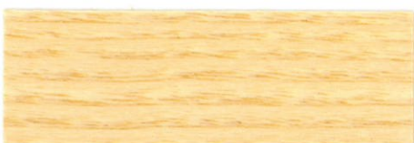
Incoloro / Brillante

Estas muestras están aplicadas a pistola sobre chapa de madera de fresno. El color puede tener variaciones según el tipo de madera y el grosor de la capa.