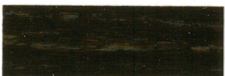
Nogal oscuro / Satinado