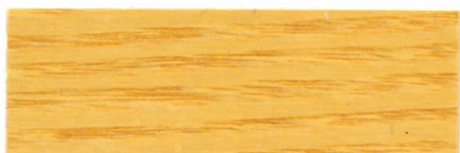
Incoloro / Satinado