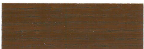
Teca / Satinado