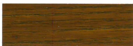
Nogal / Brillante