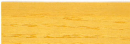
Incoloro / Brillante