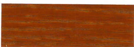
Caoba / Brillante