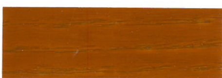
Pino / Brillante