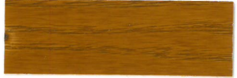
Roble / Brillante