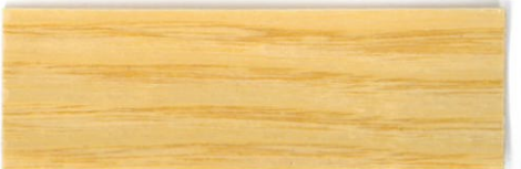
Incoloro / Brillante