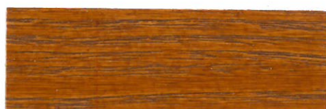
Pino viejo / Satinado