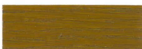
Roble / Satinado