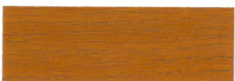
Pino / Satinado