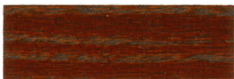
Caoba / Satinado