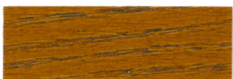
Roble / Satinado