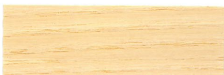
Incoloro / Mate