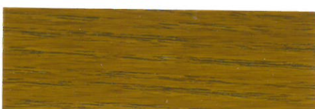
Roble / Brillante