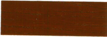
Teca / Brillante