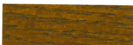
Roble Francés / Satinado